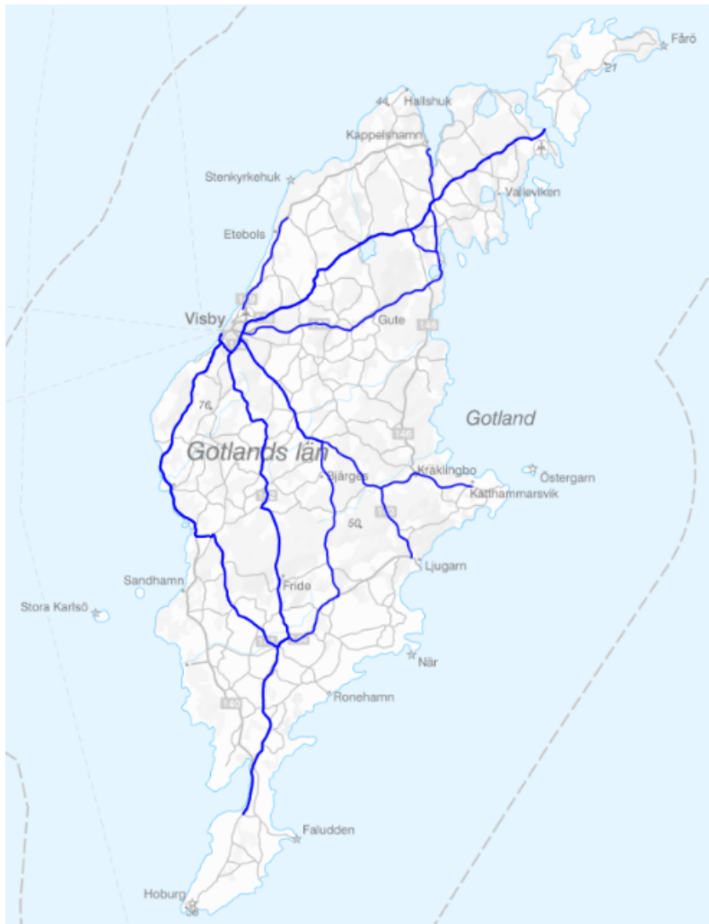
Bild 2.1 Funktionellt prioriterat vägnät för Gotland. Sammantaget utpekande för dagliga och långväga personresor, godstransporter och kollektivtrafik. Källa: Nationella vägdatabasen, hämtad 2025-04-29.

Inom ramen för Trafikverkets ansvar ligger även vägfärjetrafiken till och från Fårö. Regionfullmäktige valde i februari 2021 att inte gå vidare i planeringen för en bro under de förutsättningar som Trafikverket ställde upp avseende finansiering. Region Gotlands ställningstagande för en bro mellan Gotland och Fårö kvarstår dock alltjämt.