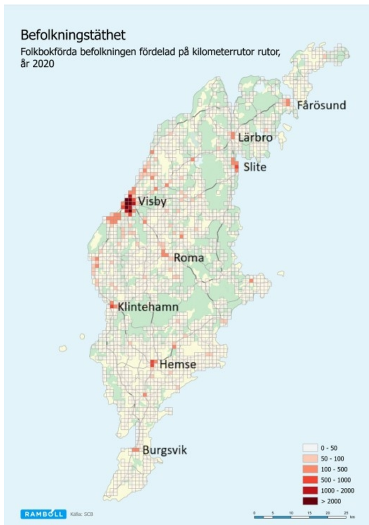
Bild 2.2 Befolkningstäthet. Folkbokförda befolkningen fördelad på kilometerrutor, år 2020. Ju mörkare färg på kartan (vitt till rött), ju fler bosatta inom respektive kvadratkilometer.

Utöver fasta bostäder finns cirka 12 500 fritidsbostäder på Gotland, varav knappt tre fjärdedelar ägs av personer folkbokförda i andra län. 5 Utöver det är Gotland ett populärt turistmål. År 2024 registrerades totalt 973 200 gästnätter. 6 Besöksnäringen på Gotland är starkt säsongsbetonad. Liksom den fasta befolkningen bor besökarna spritt över Gotland och besöksmålen finns över hela ön.